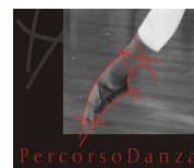
A.S.D. Percorso Danza