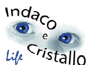
Associazione Indaco e Cristallo Life