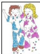
Scuola dell'Infanzia "R. Cardarelli"